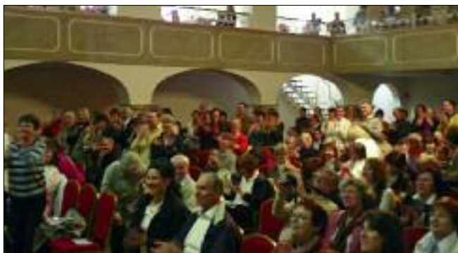
3. Internationaler Kongress für Theomedizin®